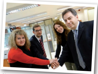
Η συνεργασία και η ομαδικότητα χαρακτηρίζουν την εταιρική κουλτούρα και συνοχή.