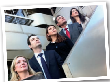
Η Εταιρεία επενδύει στην ανάπτυξη του ανθρωπίνου δυναμικού.