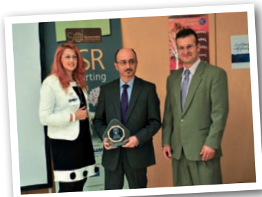
Ο Απολογισμός ΕΚΕ της INTERAMERICAN αξιολογείται στην τρίτη θέση σε επίδοση δεικτών κατά GRI-G3.1, στο σύνολο των Απολογισμών στην Ελλάδα.