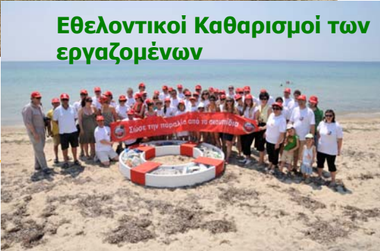
Εθελοντικοί Καθαρισμοί των εργαζομένων