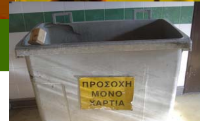
Κάδος χάρτινων απορριμάτων