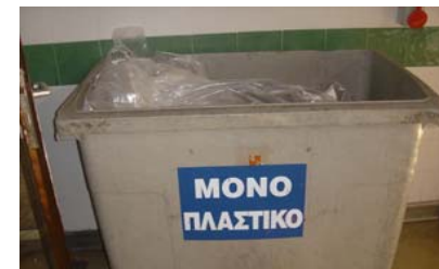
Κάδος πλαστικών απορριμάτων