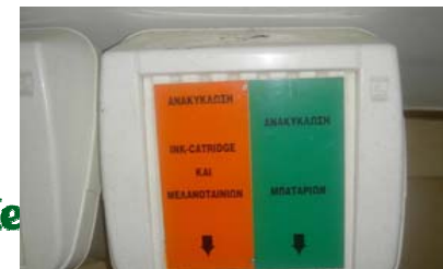
Κάδος μελανοταινιών και μπαταριών