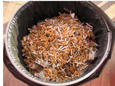
Το Οικολογικό Μπαρ της Amstel